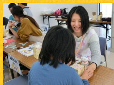
自分だけのオリジナル作品！