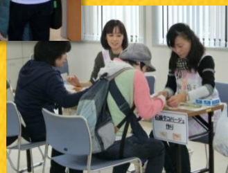
みなさん真剣にチャレンジ！