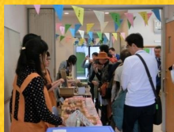
販売のコーナーは 色とりどり！